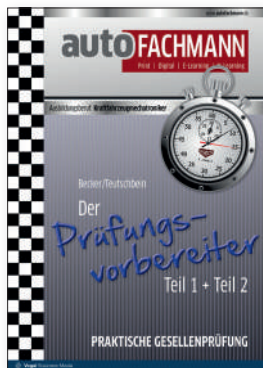
Bsp. eines Prüfungsvorbereiters